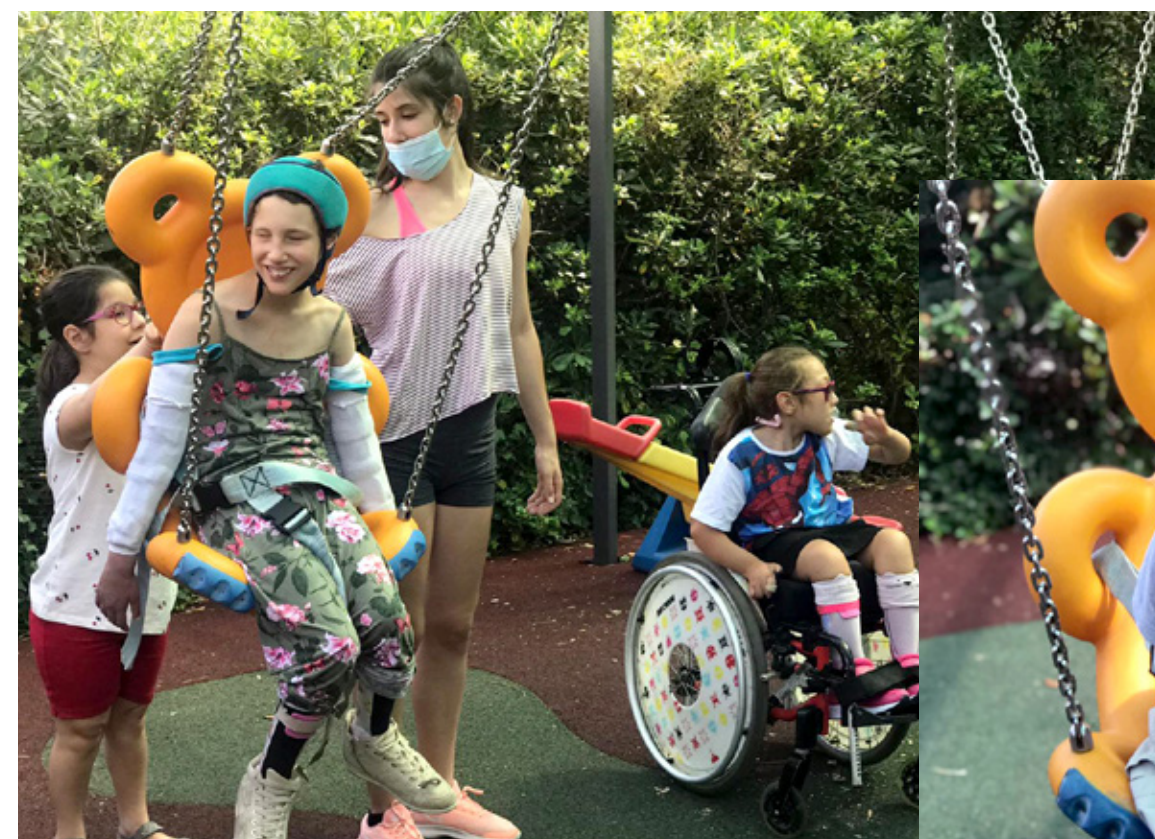
09.06.20 Tornem a l'escola!