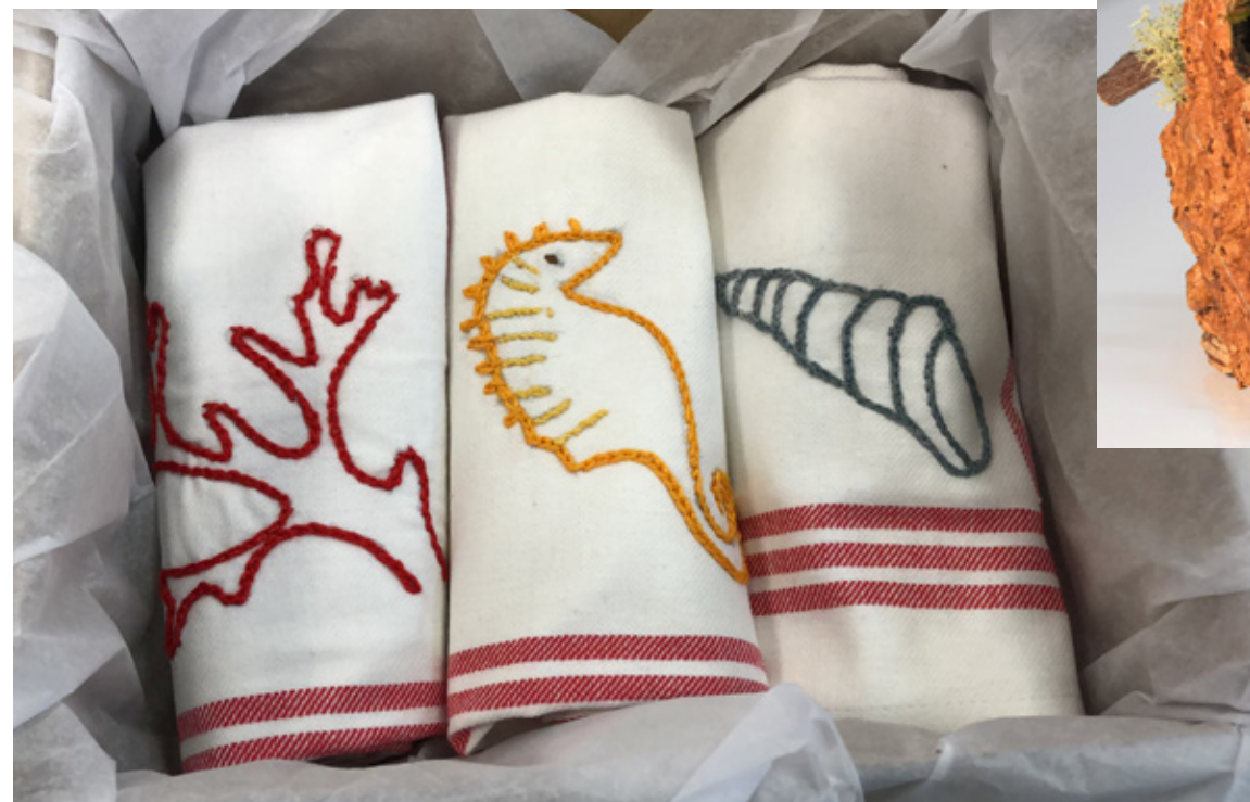
Costura, pessebres i hotel d'insectes SENTIT

Arran de la pandèmia, no podem assistir a les fires i als mercats de Nadal que ens van tan bé per visibilitzar i vendre els productes SENTIT. Per tal de mantenir l'activitat als tallers ocupacionals, obrim la botiga solidària en línia d'Aspasim.